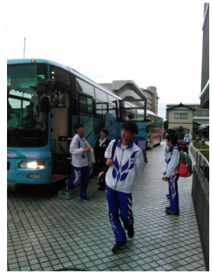
宿舎に 到着しました 立派なホテルだ！！ 素晴らしい おもてなし