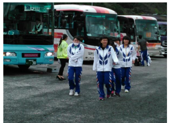
賤ヶ岳サービスエリア(しずがたけ)でのひととき